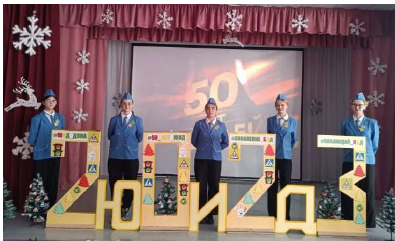
ЮИДовцы Дона гимназии №3 города Аксая ПОЗДРАВЛЯЮТ ВСЕХ С НОВЫМ 2023 ГОДОМ! И уверены, что 50-летний юбилей образования отрядов ЮИД в России все отметят новыми эффективными мероприятиями, направленными на пропаганду соблюдения ПДД. Всем добрых и безопасных дорог!